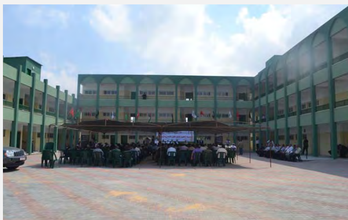
L'école élémentaire Adnan al-Ghoul de Gaza

5. Adnan al-Ghoul , au nom duquel a été baptisée l'école, n'était pas un terroriste "ordinaire" mais un des responsables de la branche armée du Hamas dans la bande de Gaza , spécialisé, notamment, dans la préparation d'engins explosifs et le développement pour le Hamas du système de roquettes Qassam (et surnommé "le père des Qassam"). Bras droit de Muhammad Deif , le responsable de la branche armée du Hamas, il a joué un rôle important dans la tentative du Hamas de torpiller les accords d'Oslo. Ainsi, Adnan al-Ghoul a été impliqué dans la préparation d'engins piégés pour l'attentat du carrefour de Beit Lid (Janvier 1995, 22 Israéliens tués) et dans la préparation de la ceinture piégée du terroriste qui s'est fait exploser au Dizengoff Center de Tel-Aviv (Mars 1996, 10 Israéliens tués). Il a été tué dans une opération ciblée de l'armée de l'air israélienne le 21 octobre 2004.