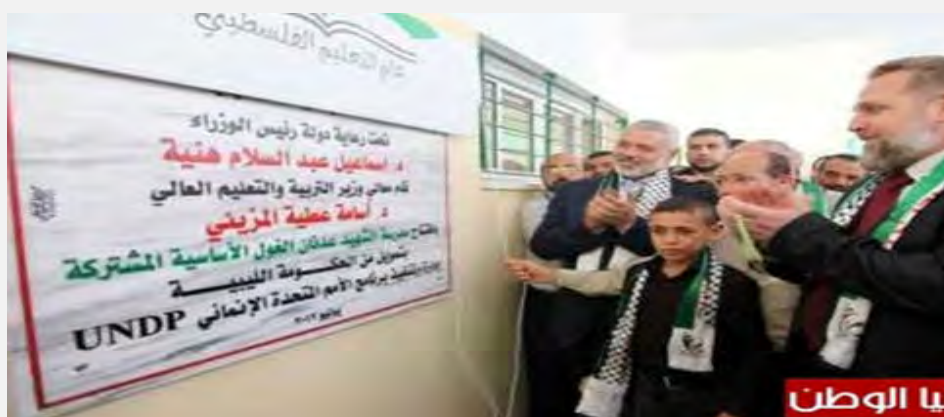
Inauguration de l'école élémentaire "Adnan al-Ghoul" à Gaza, financée par la Libye, sous l'égide du responsable de l'administration du Hamas, Ismail Haniya, et de l'ONU