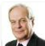
David de Rothschild