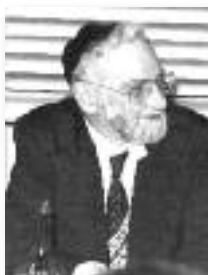
Léon Askenazi. Manitou