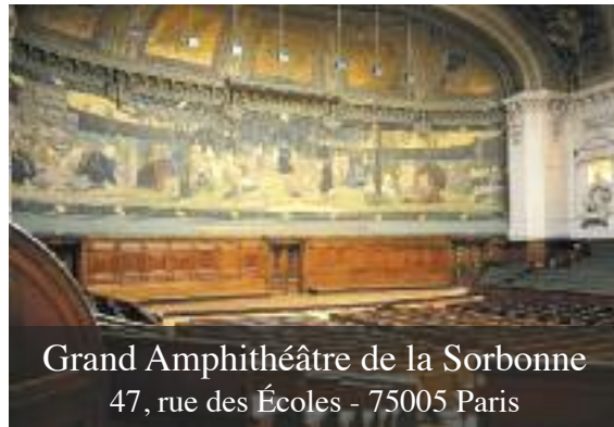
Grand Amphithéâtre de la Sorbonne 47, rue des Écoles - 75005 Paris