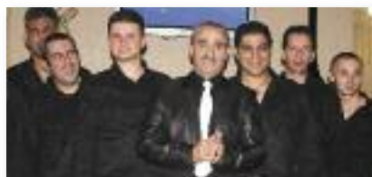
Troupe Lehakat Sfatayim