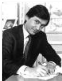
P. Douste Blazy