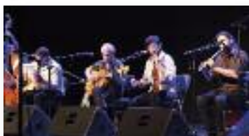
Orchestre andalous d'Israël