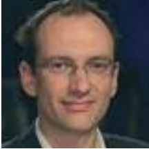
TABLE-RONDE : « Israël, le Proche-Orient et l'Europe : une réflexion géopolitique ? »