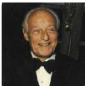
Guy de Rothschild