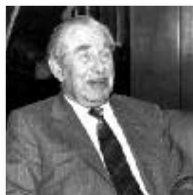
Président Chaïm Herzog