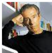
Jean-Louis Servan Schreiber