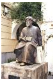
Statue de maïmonide à Cordoue