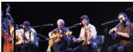
Orchestre andalous d'Israël

En partenariat avec la Communauté de Bonneuil.